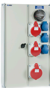
VOIMA 0033 VOIMA 0123