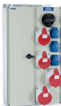
VOIMA 0043 VOIMA 0133 VOIMA 0223 VOIMA 0313