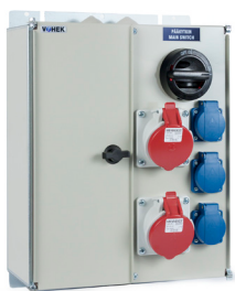
VOIMA 023 VOIMA 113