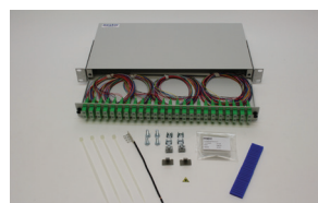
Päätepaneeli NC-200 12- ja 48-kuituisena häntäkuitupakettina