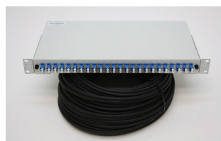
Päätepaneeli NC-200 24- ja 48-kuituisena häntäkaapelipakettina