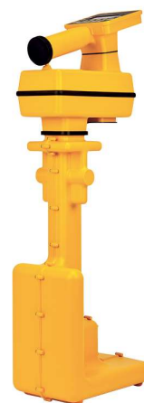
3M™ Dynatel™ 7420E EMS Antennin ja Merkintänauhan hakulaite