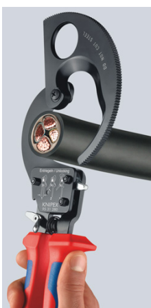
95 31 280: suuri kapasiteetti: max. Ø 52 mm / 380 mm 2