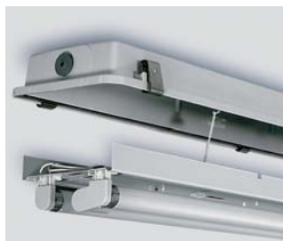
Komponenttilevyn ripustus asennettaessa.