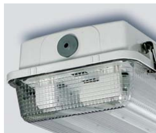
Kaa­peliläpivi­enti EPDM ma­te­riaa­lis­ta.