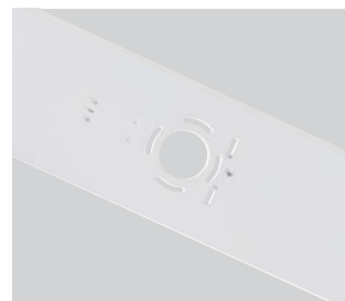
Kattorasiaan sopivat kiinnitysaukot (28W)