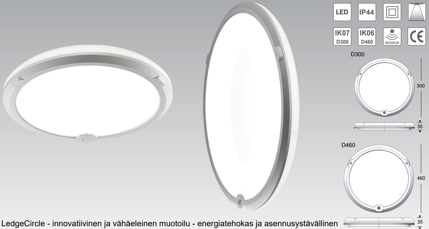
LedgeCircle - innovatiivinen ja vähäeleinen muotoilu - energiatehokas ja asennusystävällinen