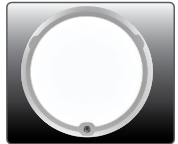
LedgeCircle PIR sensorilla

120420 Kaukosäädin HRC-05 PIR MinMaxOff valaisimelle