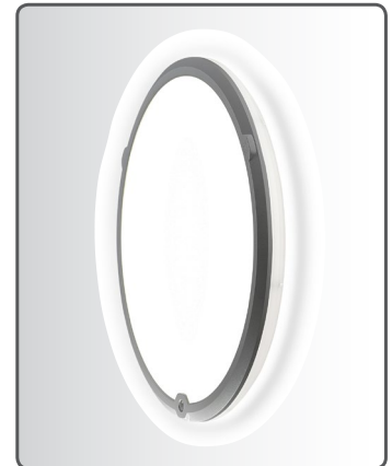
LedgeCircle tuottaa taka/sivuvaloa