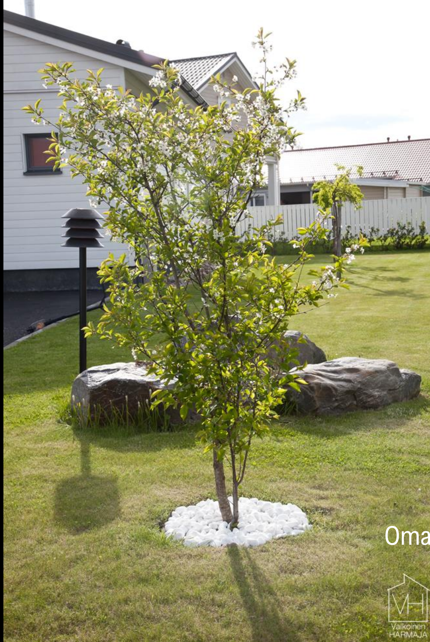
Omakotitalon piha, Lahti