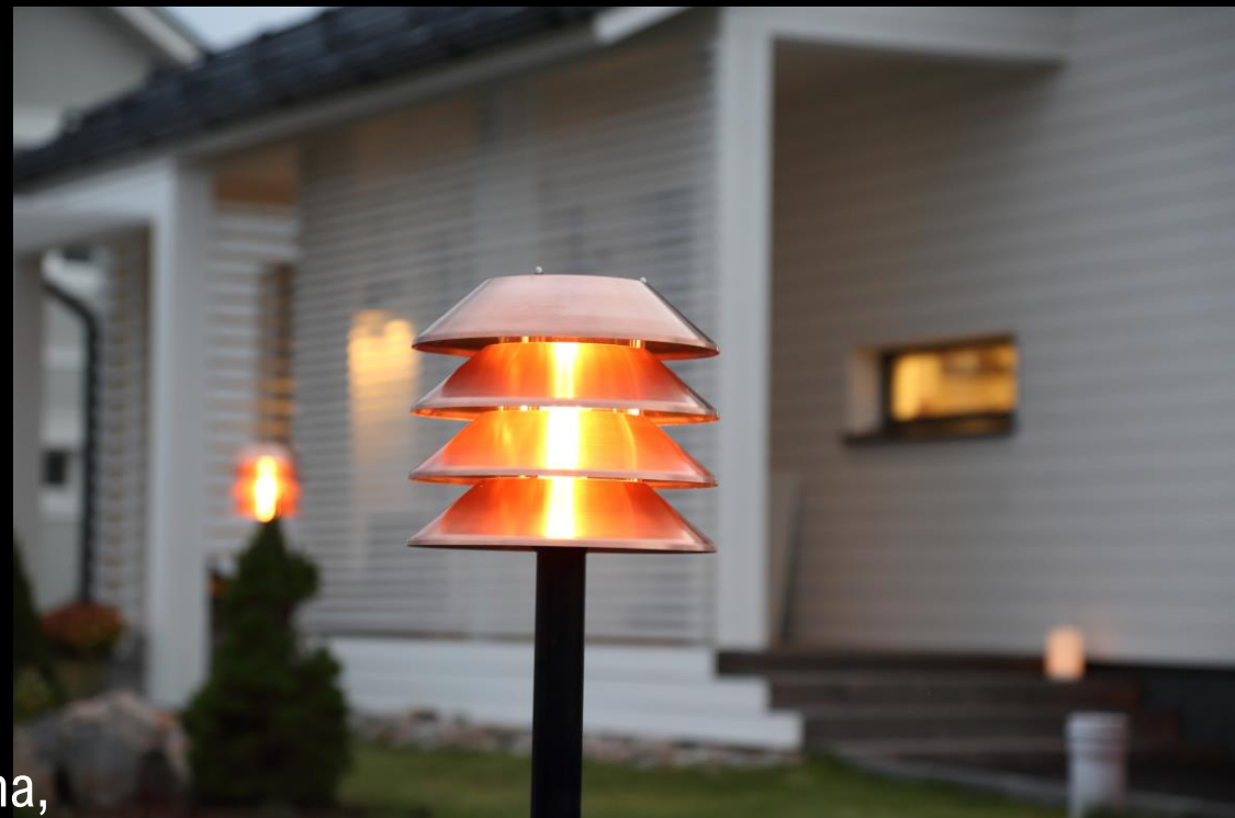
Omakotitalon piha, Lahti