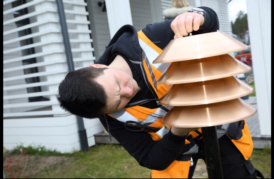
Omakotitalon piha, Lahti