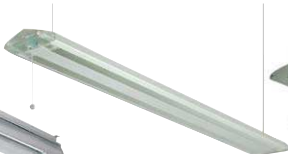
Callisto 43 057 10