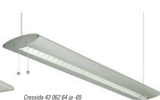
Cressida 43 062 64 ja -65

Exaktoria Zodiac-valaisin (IP23) on suunniteltu teollisuusympäristön vaativiin olosuhteisiin. Zodiac-valaisimissa on ainutlaatuinen alumiininen valaisinta jäähdyttävä runko, jonka ansiosta myös liitäntälaitteiden käyttöikä on poikkeuksellisen pitkä. Zodiac T5 -valaisimille myönnetäänkin 8 vuoden takuu. Pitkä käyttöikä vähentää merkittävästi ylläpitokustannuksia ja keventää luonnon raaka-aineiden käyttöön kohdistuvaa rasitusta.